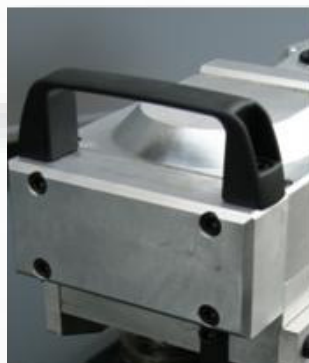
Handliche und einfache Bedienung